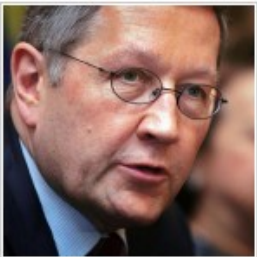
Τις προσπάθειες εξυγίανσης των δημόσιων οικονομικών που καταβάλλει η ελληνική κυβέρνηση επαινέσε ο επικεφαλής του EFSF, Κλάους Ρέγκλινγκ.